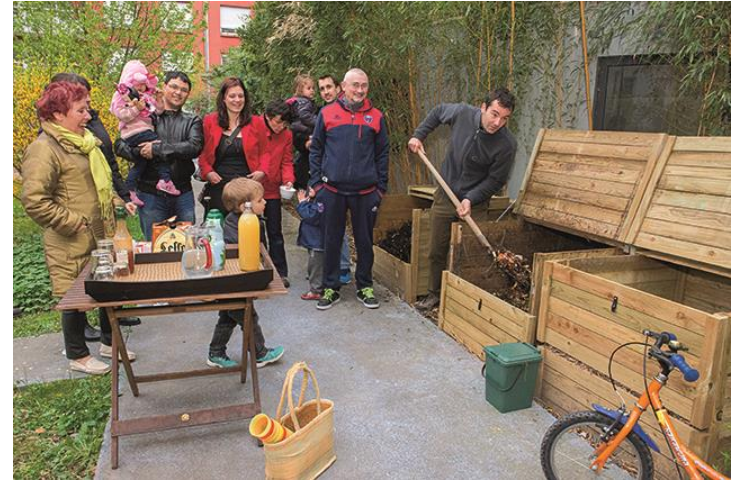
Tous au compost, avril 2016 (Grenoble)