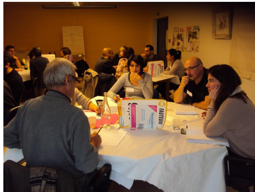
CA élargi Auvergne Rhône-Alpes, janvier 2016