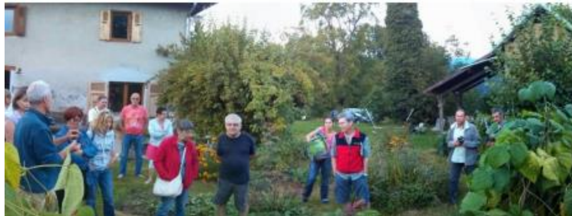
Café compost, juin 2016 (Savoie)