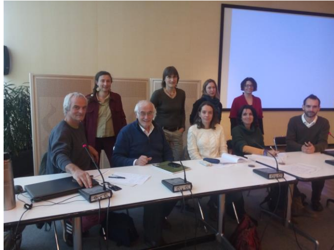
AG du 30 novembre 2015