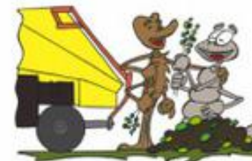
Broyage de quartier